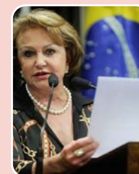
Elcione Barbalho (MDB) – Reeleição