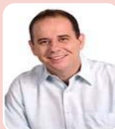
Lúcio Vale (PR) - Vice-Governador na Chapa de Helder Barbalho