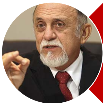
Simão Jatene (PSDB)

Mandato termina em 2019. Não é candidato a nenhum cargo.