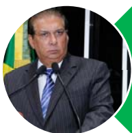
Jader Barbalho (MDB)

Mandato encerrará em 2023. Candidato ao governo.