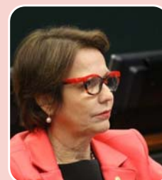
Tereza Cristina (DEM) - Reeleição