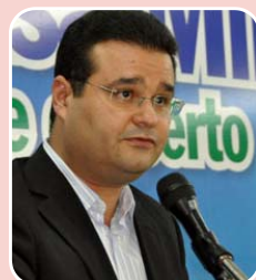
Fábio Trad (PSD) - Reeleição