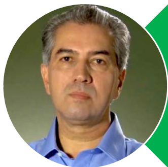
Reinaldo Azambuja (PSDB)

Mandato termina em 2019. Tenta a reeleição.