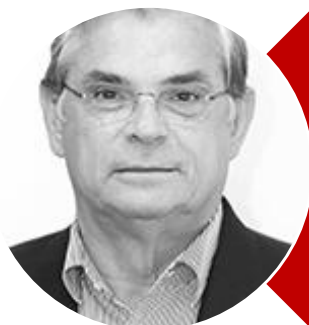
Eduardo Pinho Moreira (PMDB)

Mandato termina em 2019. Disputa vaga de senador do estado de Santa Catarina.