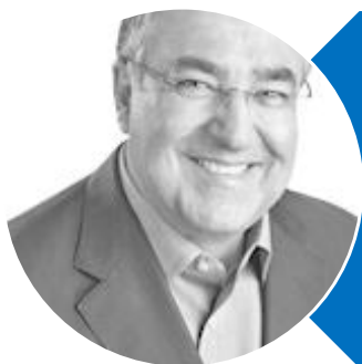
Raimundo Colombo (PSD)

Mandato termina em 2019. Disputa vaga de senador do estado de Santa Catarina.