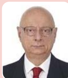
Esperidião Amin (PP) - Senado