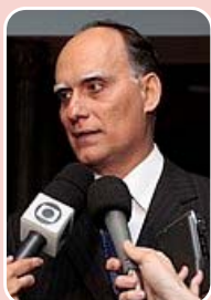
João Paulo Papa (PSDB) - Reeleição

Principais bases: Santos - 66.787 (56,796%) São Vicente - 10.144 (8,627%) Guarujá - 9.240 (7,858%) Total de votos: 117.590