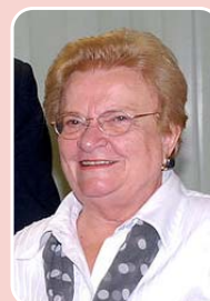
Luiza Erundina (PSOL) - Reeleição

Principais bases: Campinas - 42.884 (40,746%) Sumaré - 5.048 (4,796%) Pedreira - 4.294 (4,080%) Total de votos: 105.247