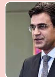
Rodrigo Garcia (DEM) - Vice-governador de João Doria (PSDB)

Principais bases: São Paulo - 13.513 (20,111%) Mogi das Cruzes - 2.650 (3,944%) Arujá - 2.572 (3,828%) Total de votos: 67.191