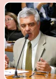
Major Olímpio (PSL) - Senado

Principais bases: São Paulo - 134.407 (75,817%) Osasco - 2.926 (1,651%) Santo André - 2.764 (1,559%) Total de votos: 177.279