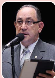
Paulo Freire (PR) - Reeleição

Principais bases: São Paulo - 26.602 (23,901%) Campinas - 11.932 (10,721%) Guarulhos - 4.351 (3,909%) Total de votos: 111.300