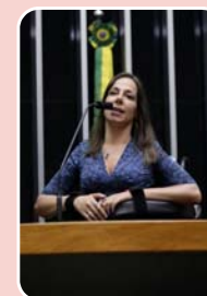
Mara Gabrilli (PSDB) - Senado

Principais bases: São Paulo - 60.208 (33,599%) Presidente Venceslau - 6.525 (3,641%) Guarulhos - 5.045 (2,815%) Total de votos: 179.196