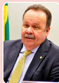
Goulart (PSD) - Reeleição

Principais bases: São Paulo - 45.942 (38,271%) Guarulhos - 4.858 (4,047%) Campinas - 2.334 (1,944%) Total de votos: 120.044