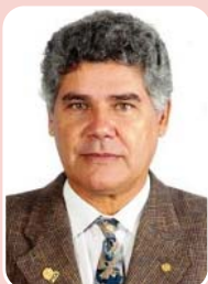
Chico Alencar (PSOL) – Senado