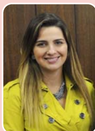
Clarissa Garotinho (PROS) – Reeleição

Niterói - 19.603 (37,121%) São Gonçalo - 4.450 (8,427%) Campos dos Goytacazes - 4.271 (8,088%) Total de votos: 52.809