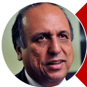
Luiz Fernando Pezão (MDB)

Mandato termina em 2019. Não é candidato a nenhum cargo.