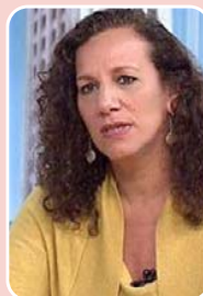
Jandira Feghali (PCdoB) – Reeleição

Principais bases: Rio de Janeiro - 261.751 (56,342%) São Gonçalo - 22.581 (4,861%) Niterói - 21.828 (4,699%) Total de votos : 464.572