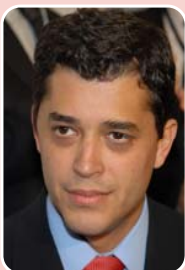
Indio da Costa (PSD) – Governo

Principais bases: Rio de Janeiro - 52.836 (57,73%) São Gonçalo - 4.331 (4,73%) Campos dos Goytacazes - 3.190 (3,49) Total de votos : 91.523