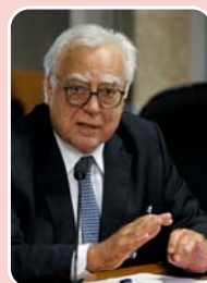
Miro Teixeira (REDE) – Senado

Rio de Janeiro - 19.467 (43,805%) Duque de Caxias - 3.748 (8,434%) São Gonçalo - 2.466 (5,549%) Total de votos : 44.440