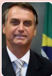
Jair Bolsonaro (PSL) – Presidente da República

Principais bases: Rio de Janeiro - 52.836 (57,73%) São Gonçalo - 4.331 (4,73%) Campos dos Goytacazes - 3.190 (3,49) Total de votos : 91.523