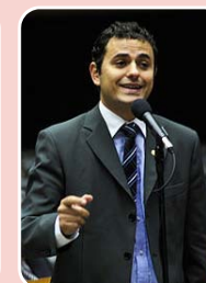
Glauber Braga (PSOL) – Reeleição

Rio de Janeiro - 15.147 (32,120%) Nova Iguaçu - 2.557 (5,422%) Duque de Caxias - 2.469 (5,236%) Total de votos: 47.157