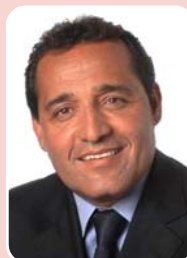
Deley (PTB) – Reeleição

Rio de Janeiro - 62.295 (76,139%) Petrópolis - 5.052 (6,175%) Belford Roxo - 1.360 (1,662%) Total de votos: 81.817