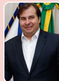
Rodrigo Maia (DEM) – Reeleição

Rio de Janeiro - 73.045 (58,866%) São Gonçalo - 12.638 (10,185%) Campos dos Goytacazes - 8.819 (7,107%) Total de votos : 124.087