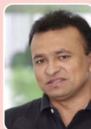
Capitão Fábio Abreu (PR) – Reeleição