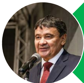
Wellington Dias (PT)

Mandato termina em 2019. Tenta a reeleição.