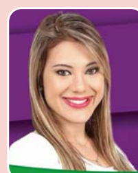
Brunny (PR) - Não é candidata

Principais bases: Barbacena - 10.009 (11,968%) Araguari - 7.006 (8,378%) Conselheiro Lafaiete - 4.457 (5,330%) Total de votos: 83.628