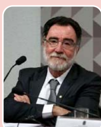
Patrus Ananias (PT) - Reeleição

Principais bases: Conselheiro Lafaiete - 6.262 (5,555%) Ouro Branco - 5.680 (5,039%) Belo Horizonte - 4.322 (3,834%) Total de votos: 112.722