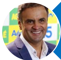
Aécio Neves (PSDB)

Mandato encerrará em 2023. É candidato ao governo.