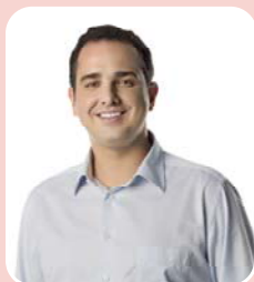
Rodrigo Pacheco (DEM) – Senado