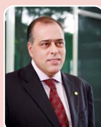
Paulo Abi-Ackel (PSDB) - Reeleição

Principais bases: Belo Horizonte - 80.262 (54,535%) Contagem - 9.974 (6,777%) Montes Claros - 3.347 (2,274%) Total de votos: 147.175