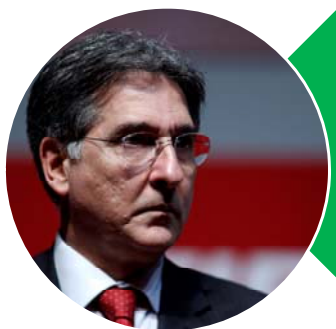
Fernando Pimentel (PT)

Mandato termina em 2019. Tenta a reeleição.