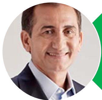
Waldez Góes (PDT)

Mandato termina em 2019. Tenta a reeleição.