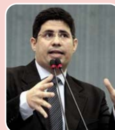
Hissa Abrahão (PDT) – Senado