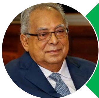
Amazonino Mendes (PDT)

Mandato termina em 2019. Tenta reeleição ao Governo.