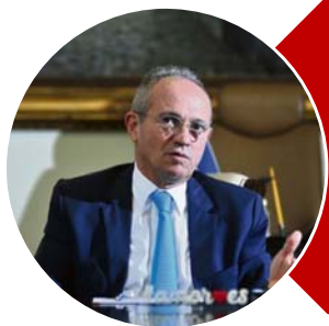
Paulo Hartung (MDB)

Mandato termina em 2019. Não é candidato.