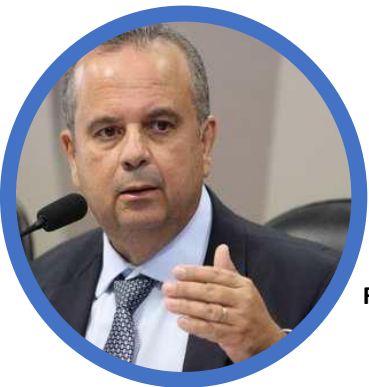
Rogério Marinho - Secretaria Especial de Previdência e Trabalho do Ministério da Economia