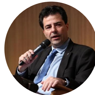
Adolfo Sachsida - Secretário de Política Econômica do Ministério da Economia