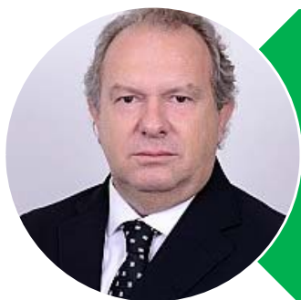
Mauro Carlesse (PHS)

Mandato termina em 2019. Tenta reeleição.