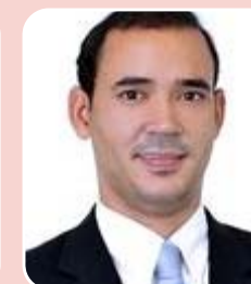
Vicentinho Júnior (PR) - reeleição

Palmas - 5.861 (14,021%) Araguaína - 2.181 (5,217%) Tocantinópolis - 2.147 (5,136%) Total de Votos: 41.802