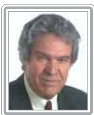
HÉLIO COSTA - PMDB/MG

Senador, 1º mandato, jornalista. Parlamentar articulado, é vice-líder do governo e do PMDB; vice-presidente da Comissão de Educação, Comunicação, Cultura e Esportes; corregedor substituto do Senado Federal; titular da Comissão de Relações Exteriores e da comissão Mista de Planos, Orçamentos Públicos e Fiscalização. Foi deputado federal por dois mandatos, quando presidiu a importante Comissão de Relações Exteriores na Câmara. Apoiou a candidatura Lula desde o início e foi um dos primeiros a apoiar a ida do PMDB para a base de sustentação do Governo. Político de boa formação intelectual, combina as defesas dos interesses nacionais com os interesses de Minas Gerais. Pela quarta vez consecutiva está entre os 100 cabeças do Congresso Nacional. Profissionalmente, foi repórter e correspondente internacional da Rede Globo. Destaca-se como debatedor.