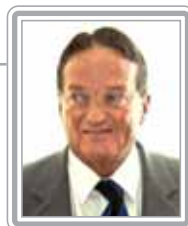
JORGE BORNHAUSEN – PFL/SC

Senador, 2º mandato, advogado. Político experiente, foi vice-governador (1962), governador (1979-82), ministro da Educação no Governo Sarney (86-87), ministro-chefe da Secretaria de Governo da Presidência da República no Governo Collor (1992), além de Embaixador do Brasil em Portugal no primeiro Governo FHC (1996-98). Fundador e presidente do PFL, lidera no partido a corrente que defende a redução do Estado por razões doutrinárias e ideológicas. De boa formação intelectual, goza de excelente trânsito, tanto no Congresso quanto nos meios empresariais. Foi diretor e membro do conselho fiscal de grandes empresas. É considerado um dos melhores estrategistas da política nacional. Destaca-se como formador de opinião.