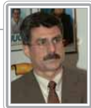
ROMERO JUCÁ - PMDB/RR

Senador, 2º mandato, economista. Político experiente, foi chefe de gabinete da Secretaria de Estado da Habitação (1979), governador de Roraima nomeado pelo presidente da República (1989-90) e secretário nacional de Habitação (1992), além de presidente da FUNAI. Iniciou sua vida pública pelas mãos de Marco Maciel. Parlamentar atuante, já pertenceu ao PFL, quando foi vice-líder do partido, e ao PSDB, quando foi vice-líder e líder do Governo FHC no Senado. Recentemente migrou para o PMDB, aonde vem tendo uma desenvoltura de veterano. Nas legislaturas anteriores, foi relator da reforma administrativa e do projeto de carreiras exclusivas no Senado. Atual vice-líder do Governo no Senado, destaca-se como debatedor.