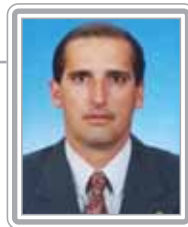
ONYX LORENZONI - PFL/RS

Deputado, 1º mandato, empresário e veterinário. Com a experiência de quem foi presidente do Sindicato dos Médicos Veterinários e deputado estadual por dois mandatos, estreou na Câmara Federal com desenvoltura de veterano. Liberal convicto, membro titular da Comissão de Finanças e Tributação, ganhou projeção pelo combate às propostas de reforma previdenciária e tributária do Governo Lula. Adversário do PT desde a gestão de Olívio Dutra no Governo do Rio Grande do Sul, é um dos vice-líderes do PFL mais ativos nos trabalhos de plenário e das comissões. Destaca-se como debatedor.