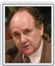
CRISTOVAM BUARQUE - PT/DF

Deputado, 2º mandato, advogado. Com a experiência de dois mandatos como deputado estadual e secretário de Transporte do Rio Grande do Sul no Governo Olívio Dutra, conseguiu facilmente integrar o restrito grupo dos parlamentares influentes do Congresso Nacional. Conhecedor dos problemas de infra-estrutura, foi designado vice-líder do Governo na Câmara. Um dos vice-líderes mais requisitados, coordena as negociações da nova Lei de Falências. Articulado politicamente e com excelente trânsito entre os parlamentares, incluindo os de oposição, teve papel importante na votação da reforma Tributária do Governo Lula. Político de posições firmes, é muito respeitado pela seriedade com que exerce seu mandato. Destaca-se como negociador.