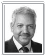
DR. HÉLIO - PDT/SP

Senador, 1º mandato, goiano, promotor e procurador de justiça. Parlamentar de sólida formação jurídica, militou no movimento estudantil e na OAB-GO. Foi secretário estadual de Segurança Pública no Governo de Marconi Perillo (1999 a 2002), presidente do Conselho de Direitos Humanos de Goiás e Procurador-Geral de Justiça do Estado. Apesar de nunca haver exercido mandato parlamentar, estreou no Senado com desenvoltura de veterano. Respeitado por seu saber jurídico e pela forma cortês como se relaciona com seus colegas senadores, goza de excelente trânsito no Senado. Membro titular da Comissão de Constituição, Justiça e Cidadania, é um dos expoentes desse órgão técnico do Senado Federal. Atento aos temas da atualidade, combina o interesse nacional com a representação dos interesses regionais, notadamente de seu Estado. Destaca-se como debatedor.