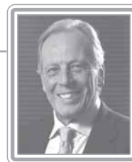
DR. PINOTTI - PFL/SP

Deputado, 2º mandato, médico e professor. Parlamentar experiente, foi secretário de Educação do Governo Franco Montoro (1986-1987) e de Saúde em São Paulo, na gestão do ex-governador Orestes Quécia (1988-1991). Político ativo, de excelente formação intelectual, prioriza em seu mandato as áreas de saúde e previdência. Eleito pelo PMDB e recém-filiado ao PFL, é aliado dos assalariados e defensor da economia nacional. Político de perfil progressista, com posições de centro-esquerda, tem marcado seus mandatos por ações propositivas e atuação independente em relação ao Poder Executivo, tanto no Governo FHC, quanto na gestão Lula. Bom debatedor, destaca-se como formulador.