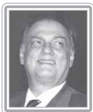
ROBERTO FREIRE - PPS/PE

Deputado, 5º mandato, advogado e professor. Parlamentar experiente, foi presidente da Caixa e do Banco de Desenvolvimento Mineiro, além de subsecretário de Planejamento e Coordenação-Geral do Estado (1972-73), secretário da Fazenda do Estado, no Governo Tancredo Neves (1991-94) e, mais recentemente, ministro da Previdência do Governo Fernando Henrique Cardoso. Especialista nas áreas financeira e tributária, é defensor da economia de mercado. Relator da Proposta de Emenda Constitucional que regulamenta o uso de medidas provisórias, presidiu a Comissão Especial que tratou da reforma da Previdência no Governo Lula. Destaca-se como formulador.