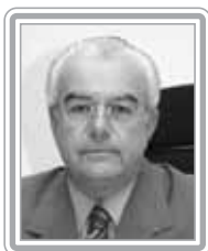
FERNANDO BEZERRA – PTB/RN

Deputado, 3º mandato, engenheiro civil e administrador. Político experiente, já exerceu os cargos de ministro dos Transportes, no Governo Figueiredo, e da Fazenda, no Governo Itamar Franco, além de ter sido presidente da Eletrobrás. Ex-presidente da Comissão de Finanças e Tributação, também já presidiu a Comissão de Minas e Energia da Câmara. Especialista em infra-estrutura, é consultado com frequência sobre transporte, mineração, petróleo, energia elétrica, telecomunicações e finanças públicas. Foi relator de vários projetos relevantes, entre os quais o que regulamentou a quebra do monopólio estatal do petróleo. Discreto em sua atuação, hábil e articulado, destaca-se como formulador.