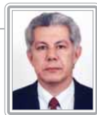
ARLINDO CHINAGLIA - PT/SP

Deputado, 3º mandato, médico. Parlamentar dinâmico, o atual líder do PT na Câmara foi um dos principais fiscalizadores e críticos da política econômica do Governo FHC. Como presidente da Comissão de Fiscalização e Controle, vice-líder do PT e especialista em Seguridade Social credenciou-se para liderar o PT na Câmara. Antes foi escalado pelo partido para coordenar as negociações das emendas de bancada sobre a reforma da Previdência, contribuindo para importantes avanços na proposta original do Governo. Com a experiência de quem foi presidente do Sindicato dos Médicos, presidente da CUT/SP, presidente do PT de São Paulo, Secretário-Geral do Diretório Nacional do PT e secretário das subprefeituras na gestão Marta Suplicy em São Paulo, Arlindo está tendo papel destacado na defesa do Governo Lula no Congresso. Bom orador, habilidoso no manejo das palavras, vem se revelando um negociador brilhante. Debatedor qualificado, é respeitado pela situação e pela oposição pela clareza dos argumentos e firmeza na defesa de seus pontos de vistas. Destaca-se também como formulador.