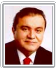
NEY LOPES - PFL/RN

Deputado, 6º mandato, advogado, jornalista e professor de Direito Constitucional. Político de sólida formação jurídica e grande prestígio no Congresso, foi presidente da Comissão de Constituição, Justiça e Redação e da Comissão de Ciência e Tecnologia, Comunicação e Informática, além de um dos vice-líderes mais ativos do PFL na Câmara. Já foi vice-prefeito de Natal e secretário de Governo e de Justiça do Rio Grande do Norte. Parlamentar de fortes convicções liberais, foi relator da PEC 05/95, que modificou o conceito de empresa brasileira e abriu o subsolo ao capital estrangeiro, da Lei de Patentes, da Lei das Inelegibilidades, da Lei do Sigilo Bancário e Fiscal, da Medida Provisória que criou o Plano Real, da CPI dos Medicamentos, entre outras. Atual presidente do Parlamento Latino-Americano, destaca-se como formulador.