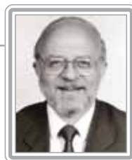
ALBERTO GOLDMAN - PSDB/SP

Deputado, 6º mandato, engenheiro civil. Parlamentar experiente e articulado, foi secretário de Estado em São Paulo, no Governo Quéricia, e ministro dos Transportes no Governo do presidente Itamar Franco. Primeiro vice-líder do PSDB na Câmara, é um debatedor qualificado. Autor da fórmula de flexibilização dos monopólios do petróleo e telecomunicações, foi pioneiro na privatização das rodovias e portos. Presidiu duas importantes Comissões Especiais na quebra do monopólio e regulamentação da PEC do Petróleo, além de ter sido relator da Lei Geral de Telecomunicações. Conhecedor dos temas de infra-estrutura, destaca-se como formulador.