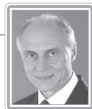
EDUARDO SUPLICY - PT/SP

Senador, 2º mandato, economista. Político experiente, é respeitado pelo saber e seriedade com que exerce seus mandatos. Autor da CPI do Orçamento, também teve atuação destacada nas CPIs da Corrupção, que levou ao impeachment de Collor, dos Precatórios e do Sistema Financeiro. Ex-líder do PT no Senado, é autor do projeto de renda mínima. Hábil articulador e bom formulador, não tem sido bem aproveitado pelo Governo Lula, em razão das divergências com o ministro-chefe da Casa Civil, José Dirceu. Seu rigor ético e o modo sempre cortês como se relaciona com as pessoas fazem do senador Suplicy um dos parlamentares mais queridos no Congresso. Destaca-se como formador de opinião.