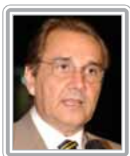
JOSÉ AGRIPINO – PFL/RN

Senador, 2º mandato, advogado. Político experiente, foi vice-governador (1962), governador (1979-82), ministro da Educação no Governo Sarney (86-87), ministro-chefe da Secretaria de Governo da Presidência da República no Governo Collor (1992), além de Embaixador do Brasil em Portugal no primeiro Governo FHC (1996-98). Fundador e presidente do PFL, lidera no partido a corrente que defende a redução do Estado por razões doutrinárias e ideológicas. De boa formação intelectual, goza de excelente trânsito, tanto no Congresso quanto nos meios empresariais. Foi diretor e membro do conselho fiscal de grandes empresas. É considerado um dos melhores estrategistas da política nacional. Destaca-se como formador de opinião.