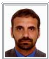
NELSON PELEGRINO - PT/BA

Deputado, 8º mandato, jornalista e advogado. Político experiente, com excelente trânsito no Congresso, integra o núcleo dos formadores de opinião. Na Constituinte, pertenceu à Comissão da Organização dos Poderes e Sistema de Governo. Ex-líder do PDT, é uma das principais referências do Congresso no debate de questões políticas e institucionais. Negociador aplicado, é muito ativo nos trabalhos de plenário e nos bastidores.