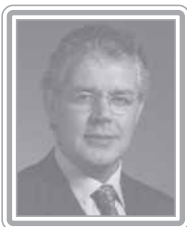
LUIZ CARLOS HAULY - PSDB/PR

Deputado, 4º mandato, economista e professor de educação física. Parlamentar experiente, foi vereador e prefeito de Cambé/PR e secretário de Fazenda do Paraná na gestão Álvaro Dias (1987 a 1990). Com bom trânsito no Legislativo, foi vice-líder e líder do Governo FHC no Congresso. Quadro do PSDB, membro da executiva nacional e vice-líder na Câmara, é um respeitado especialista em matérias fiscais e tributárias. No debate da Reforma Tributária apresentou um substitutivo global chamado "simplificação radical" cujo objetivo foi instituir o imposto seletivo monofásico e o imposto de renda progressivo de base ampliada. Muito ativo nas comissões e no plenário, foi relator do projeto que quebra o sigilo bancário e fiscal de empresas, para fins de fiscalização, e autor das Leis que estabelecem a compensação financeira entre o INSS e os Estados e Municípios, nova Lei de S.A, da transparência administrativa das contas públicas com ampla divulgação pela internet, e ampliação da abrangência do Simples. Presidiu as Comissões de Finanças e Tributação e de Relações Exteriores e Defesa Nacional, duas das mais importantes da Câmara. Destaca-se como formulador e debatedor.