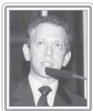
WALTER FELDMAN - PSDB/SP

Deputado, 3º mandato, economista. Líder estudantil e sindical, estreou na Constituinte como grande debatedor, tendo integrado a Subcomissão de Tributos, Participação e Distribuição de Receita, da Comissão do Sistema Tributário. Especialista em finanças públicas e assuntos de cidadania, é um dos principais coordenadores do PT na Comissão Mista de Orçamento do Congresso. Relator da Reforma Tributária do Governo Lula, surpreendeu pela capacidade de diálogo e de articulação. Parlamentar ativo, é um dos principais interlocutores do Governo em matéria orçamentária. Destaca-se como debatedor.