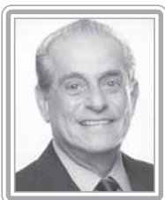
RAMEZ TEBET - PMDB/MS

Deputado, 2º mandato, professor. Com a experiência de quem foi vereador e presidente da Câmara Municipal, deputado estadual por dois mandatos e dirigente do Sindicato dos Professores da Rede Oficial de Ensino de São Paulo (Apeoesp), da Confederação Nacional dos Trabalhadores em Educação (CNTE) e da CUT estadual, estreou na Câmara com desenvoltura de veterano. Debatedor e articulador competente, foi um dos vice-líderes do PT mais ativos. Com a eleição do presidente Lula, foi inicialmente designado vice-líder e recentemente líder Governo na Câmara, função que vem desempenhando com dedicação inigualável. Um dos principais interlocutores do Poder Executivo no Congresso, destaca-se como negociador.