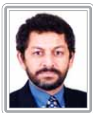
PAULO ROCHA - PT/PA

Senador, 1º mandato, metalúrgico e líder sindical. Deputado federal por quatro mandatos, foi um dos principais interlocutores dos trabalhadores, servidores públicos, aposentados e pensionistas no Congresso, tendo sido também um dos parlamentares mais produtivos do Poder Legislativo. É autor da Lei do Estatuto do Idoso, da Lei de que proíbe as discriminações e co-autor, com o deputado Inácio Arruda, da proposta de redução da jornada de trabalho, sem redução de salário. É autor ainda dos projetos que instituem o Estatuto da Igualdade Racial e o Estatuto da Pessoa Portadora de Deficiência, bem como dos principais projetos em defesa dos direitos dos trabalhadores, de salário mínimo e dos assalariados em geral. Foi presidente da Comissão de Trabalho, Administração e Serviço Público da Câmara e terceiro-secretário da Mesa Diretora da Câmara dos Deputados. No Senado, onde foi eleito primeiro-vice-presidente da Mesa Diretora, mantém-se fiel à sua luta histórica, abrindo espaços aos assalariados na Casa. Ativo, persistente e afável no trato com os colegas, já conquistou a simpatia dos senadores. Destaca-se como formulador.