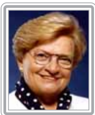
LUIZA ERUNDINA - PSB/SP

Deputado, 4º mandato, advogado. De sólida formação jurídica, foi presidente da Comissão de Constituição e Justiça da Câmara, quando prestou relevantes serviços ao Governo Lula. Político atuante e bem articulado, foi vice-prefeito de São Paulo, na gestão de Luiza Erundina, além de secretário de Defesa Social e secretário dos Negócios Extraordinários. Com predileção pelas áreas de direitos humanos, meio ambiente e relações internacionais, é referência nessas matérias no Congresso. Com excelente trânsito na Câmara, é um parlamentar em franca ascensão no Legislativo. Destaca-se como negociador.