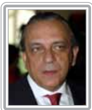
SÉRGIO GUERRA - PSDB/PE

Deputado, 2º mandato, empresário e administrador de empresas. Com a experiência de quem foi deputado estadual e dirigente sindical patronal, estreou na Câmara, em 1995, com surpreendente capacidade de articulação, e foi escolhido vice-líder do PMDB e vice-líder do Governo no primeiro mandato do ex-presidente FHC. Atual líder do PL, foi vice e presidente da Comissão de Trabalho, Administração e Serviço Público. Debatedor qualificado, é muito assíduo às reuniões das comissões e do plenário. Liberal convicto, é defensor da livre iniciativa e da economia de mercado, bem como da terceirização, da flexibilização e da desregulamentação das relações de trabalho. Com excelente trânsito no Congresso, destaca-se como debatedor.