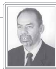
INÁCIO ARRUDA - PCdoB/CE

Deputado, 3º mandato, servidor público. Identificado com as lutas populares, sempre atuou como coordenador no Estado de movimentos cívicos como nas Diretas-Já, no impeachment de Collor, além de liderar o movimento de moradores de bairros e favelas de Fortaleza. Antes de chegar à Câmara Federal, foi vereador em Fortaleza e deputado estadual no Ceará. Ex-líder do PCdoB na Câmara, foi também presidente da Comissão de Desenvolvimento Urbano. Autor da Proposta de Emenda Constitucional que fixa a jornada em 40 horas semanais, é um parlamentar muito atuante no Congresso. Defensor dos assalariados sofreu por ocasião da votação da reforma da Previdência, que suprimia direitos dos servidores. Além dos direitos sociais dos trabalhadores, prioriza as questões urbanas, como habitação popular e saneamento. Destaca-se como debatedor.