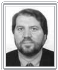
RENILDO CALHEIROS – PCdoB/PE

Deputado, 2º mandato, geólogo. Atual líder do PCdoB, foi um eficiente vice-líder do Governo Lula na Câmara. Oriundo do movimento estudantil, foi presidente da UNE – União Nacional dos Estudantes e vice-presidente da executiva nacional do PCdoB. É irmão do deputado federal Olavo Calheiros (PMDB/AL) e do Senador Renan Calheiros, atual líder do PMDB no Senado. Foi vereador em Recife (1989-1991), secretário de Governo de Olinda (2001 e 2002) e secretário-adjunto do Governo do Estado de Pernambuco no 3º governo de Miguel Arraes (1995-1999). Habilidade articulador, com excelente trânsito no Congresso, destaca-se como negociador.