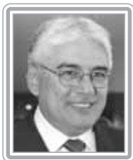
EFRAIM MORAIS – PFL/PB

Senador, 1º mandato, engenheiro civil. Líder da Minoria no primeiro ano do Governo Lula, destacou-se como debatedor no Senado. Parlamentar experiente, foi diretor técnico da Superintendência de Obras do Plano de Desenvolvimento do Estado da Paraíba (1979-82), deputado estadual por dois mandatos (1983-91) e deputado federal por três mandatos. Na Câmara dos Deputados, foi 4ª secretário e 1º vice-presidente da Mesa Diretora da Casa. No Senado, tem sido um opositor ferrenho do Governo Lula, com presença e críticas ácidas à administração petista nas comissões e no plenário.