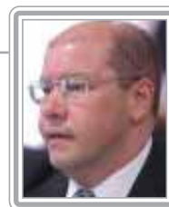
DEMÓSTENES TORRES - PFL/GO

Senador, 1º mandato, goiano, promotor e procurador de justiça. Parlamentar de sólida formação jurídica, militou no movimento estudantil e na OAB-GO. Foi secretário estadual de Segurança Pública no Governo de Marconi Perillo (1999 a 2002), presidente do Conselho de Direitos Humanos de Goiás e Procurador-Geral de Justiça do Estado. Apesar de nunca haver exercido mandato parlamentar, estreou no Senado com desenvoltura de veterano. Respeitado por seu saber jurídico e pela forma cortês como se relaciona com seus colegas senadores, goza de excelente trânsito no Senado. Membro titular da Comissão de Constituição, Justiça e Cidadania, é um dos expoentes desse órgão técnico do Senado Federal. Atento aos temas da atualidade, combina o interesse nacional com a representação dos interesses regionais, notadamente de seu Estado. Destaca-se como debatedor.