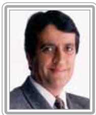
VALDEMAR COSTA NETO - PL/SP

Senador, 1º mandato, médico. Irmão do governador do Acre, Jorge Viana, é um parlamentar em franca ascensão no Congresso. De atuação discreta, com o mandato inicialmente voltado para os interesses regionais e os temas ligados à saúde pública, ganhou projeção como líder do PT no Senado, quando revelou uma grande capacidade de articulação e negociação. Fiel e leal ao Governo Lula, de quem é um interlocutor privilegiado, recebeu a missão de relator da reforma da Previdência no Senado, um tema dos mais complexos. Destaca-se como negociador.