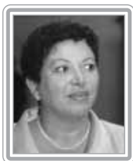
IDELI SALVATTI - PT/SC

Deputado, 7º mandato, advogado e professor universitário. Ministro da Justiça no Governo Figueiredo, é um dos juristas mais requisitados no Congresso. Foi relator-adjunto do então deputado e atual ministro do STF, Nelson Jobim, na revisão constitucional. Respeitado por seu saber e capacidade de argumentação, é consultado com frequência pelos colegas da Comissão de Constituição e Justiça, notadamente em assuntos eleitorais, regimentais e questões políticas e institucionais. Apesar de discreto, é um excelente orador. Destaca-se como formulador.