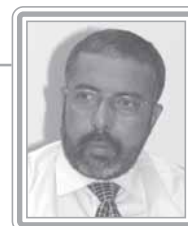
PAULO PAIM - PT/RS

Senador, 1º mandato, metalúrgico e líder sindical. Deputado federal por quatro mandatos, foi um dos principais interlocutores dos trabalhadores, servidores públicos, aposentados e pensionistas no Congresso, tendo sido também um dos parlamentares mais produtivos do Poder Legislativo. É autor da Lei do Estatuto do Idoso, da Lei de que proíbe as discriminações e co-autor, com o deputado Inácio Arruda, da proposta de redução da jornada de trabalho, sem redução de salário. É autor ainda dos projetos que instituem o Estatuto da Igualdade Racial e o Estatuto da Pessoa Portadora de Deficiência, bem como dos principais projetos em defesa dos direitos dos trabalhadores, de salário mínimo e dos assalariados em geral. Foi presidente da Comissão de Trabalho, Administração e Serviço Público da Câmara e terceiro-secretário da Mesa Diretora da Câmara dos Deputados. No Senado, onde foi eleito primeiro-vice-presidente da Mesa Diretora, mantém-se fiel à sua luta histórica, abrindo espaços aos assalariados na Casa. Ativo, persistente e afável no trato com os colegas, já conquistou a simpatia dos senadores. Destaca-se como formulador.