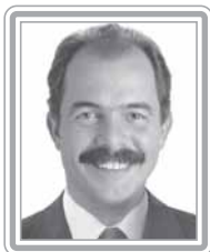
ALOIZIO MERCADANTE - PT/SP

Senador, 1º mandato, economista, professor universitário. Parlamentar de sólida formação intelectual, eleito senador com a maior votação da história do País, é respeitado pela qualidade de suas intervenções. Foi deputado federal por dois mandatos. No primeiro, destacou-se nas Comissões Parlamentares de Inquérito do PC Farias e do Orçamento. No segundo, consolidou seu prestígio na Câmara Federal com excelente condução da liderança do partido e com elogiada gestão na presidência da Comissão de Economia, Indústria e Comércio. Líder do Governo no Senado, tem feito um esforço extraordinário para defender e aprovar os projetos do Poder Executivo. Debatedor aplicado, com excelente trânsito no Congresso, destaca-se como negociador.