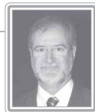
EDUARDO AZEREDO - PSDB/MG

Senador, 1º mandato, engenheiro. Com a experiência de quem foi prefeito de Belo Horizonte e governador de Minas Gerais, estreou no Senado com desenvoltura de veterano. É especialista em tecnologia da informação, tendo sido presidente da Empresa de Processamento de Dados do Estado de Minas Gerais, superintendente da DATAMEC, da Empresa de Processamento de Dados de Belo Horizonte, além de presidente do Serviço Federal de Processamento de Dados – SERPRO. Politicamente articulado e tecnicamente preparado, faz uma oposição responsável ao Governo Lula. Membro efetivo das Comissões de Assuntos Econômicos, Assuntos Sociais e de Relações Exteriores, tem surpreendido pela assiduidade e qualidade de suas intervenções. Parlamentar discreto, de forte rigor ético, destaca-se como articulador.