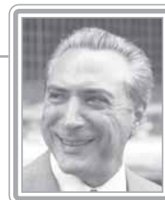
MICHEL TEMER - PMDB/SP

Deputado, 5º mandato, advogado e professor. Parlamentar de boa formação intelectual, com doutorado em Direito, é um dos poucos juristas do Congresso. Preparado, didático na forma de expor, foi eleito e reeleito presidente da Câmara dos Deputados nos períodos 1997-1998 e 1999-2000. Com passagem pelo Poder Executivo estadual, foi secretário de Segurança Pública no Governo Franco Montoro e de Governo na gestão do governador Antônio Fleury. Presidente nacional do PMDB, já foi líder do partido na Câmara. Foi relator da Emenda Constitucional nº 20/98, da reforma da Previdência. Um dos principais operadores da reforma constitucional no Governo FHC, é um dos mais influentes integrantes da elite parlamentar. Destaca-se como formador de opinião.