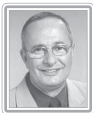
LUCIANO ZICA – PT/SP

Deputado, 5º mandato, advogado. Político experiente, de família tradicional no Estado, foi secretário da Justiça e Direitos Humanos no Governo Waldir Pires (1988-89) e ministro do Bem-Estar Social no Governo Itamar Franco (1992). Parlamentar atuante, teve presença marcante como principal negociador do PSDB e do Governo FHC durante as votações da reforma do Judiciário, tanto nas comissões quanto no plenário. Ex-líder e atual vice-líder do PSDB na Câmara, com bom trânsito no Congresso, tem feito forte oposição ao Governo Lula. Destaca-se como articulador.