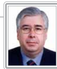
LUIZ ANTÔNIO FLEURY – PTB/SP

Deputado, 2º mandato, advogado. Com sólida formação jurídica, foi promotor e procurador no Estado de São Paulo. Político experiente, foi também secretário de Segurança Pública de São Paulo, na gestão de Orestes Quécia, e governador do Estado (1991/94). Bem articulado, é ativo nos trabalhos do plenário e das comissões. Autor de vários projetos com modificações nos Códigos Civil e Penal, foi relator parcial da reforma do Judiciário. Oriundo do PMDB, está em franca ascensão em seu novo partido: o PTB, onde é secretário-geral da executiva nacional. Membro atuante da Comissão de Trabalho, Administração e Serviço Público, com participação destacada nas Comissões de Segurança Pública e de Constituição e Justiça, foi presidente da Comissão de Minas e Energia da Câmara e ouvidor-geral da Câmara dos Deputados. Atual procurador parlamentar da Câmara, destaca-se como formulador.