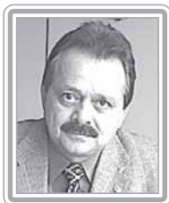
JOVAIR ARANTES – PTB/GO

Deputado, 3º mandato, cirurgião-dentista e produtor rural. Político experiente, já foi vereador (1988), secretário de Saúde do Município (1989) e presidente da Indústria Química de Goiás (IQUEGO). Vice-prefeito de Goiânia (1992), presidente da COMURG – Companhia de Urbanização de Goiânia (1993), além de deputado estadual (1991-92). Parlamentar atuante, tem sido bem avaliado pelos institutos que acompanham os trabalhos do Congresso, incluindo o jornal Folha de São Paulo. Defensor dos interesses dos servidores, aposentados e pensionistas, foi presidente da Comissão de Trabalho, Administração e Serviço Público. Foi relator de importantes projetos, entre os quais o que instituiu o regime de emprego na Administração Pública, o que tratou do plano de cargos e salários do Poder Judiciário (2001) e o que reestruturou as carreiras de auditoria da Receita, da Previdência e do Trabalho. É autor da PEC que permite ascensão funcional e do projeto que anistia os servidores públicos punidos em razão de greve. Destaca-se como articulador.