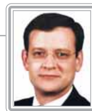
BETO ALBUQUERQUE - PSB/RS

Deputado, 2º mandato, advogado. Com a experiência de dois mandatos como deputado estadual e secretário de Transporte do Rio Grande do Sul no Governo Olívio Dutra, conseguiu facilmente integrar o restrito grupo dos parlamentares influentes do Congresso Nacional. Conhecedor dos problemas de infra-estrutura, foi designado vice-líder do Governo na Câmara. Um dos vice-líderes mais requisitados, coordena as negociações da nova Lei de Falências. Articulado politicamente e com excelente trânsito entre os parlamentares, incluindo os de oposição, teve papel importante na votação da reforma Tributária do Governo Lula. Político de posições firmes, é muito respeitado pela seriedade com que exerce seu mandato. Destaca-se como negociador.