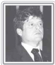
MENDES RIBEIRO FILHO - PMDB/RS

Deputado, 3º mandato, advogado. Político experiente e articulado, foi vereador em Porto Alegre (1983-87), deputado estadual (1987-91 e 1991-95), secretário de Justiça do Estado do Rio Grande do Sul (1983-84), de Obras Públicas, Saneamento e Habitação (1995-96) e extraordinário para Assuntos da Casa Civil (1996-98), além de relator da Constituição Estadual. Primeiro vice-líder do PMDB, é o principal operador de plenário do partido. Com excelente trânsito no Congresso, foi o responsável pelas negociações que resultaram na aprovação da reforma do Judiciário, do Código de Ética da Câmara e dos projetos de previdência complementar, quando atuou em favor dos assalariados, apoiando maior transparência, participação e garantia de direitos aos participantes. Destaca-se como negociador.