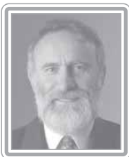
DR. ROSINHA - PT/PR

Deputado, 2º mandato, médico e servidor público. Respeitado por sua coerência política, é vinculado aos movimentos sociais. Em seus mandatos, desde o de vereador, passando por deputado estadual até deputado federal, tem priorizado a transparência na gestão pública e a defesa dos direitos sociais. Ex-dirigente sindical, teve papel destacado no combate às propostas em bases neoliberais do segundo mandato do Governo FHC. Especialista em Seguridade Social, atuou junto à bancada e ao Governo Lula para modificar a reforma da Previdência, buscando imprimir um conteúdo de justiça social, respeito a direitos adquiridos, correção de distorções e combate a privilégios. Fiel aos compromissos de campanha, divergiu das iniciativas do Governo Federal que conflitavam com as posições históricas do partido, especialmente na área social. Membro da Comissão Interparlamentar Conjunta do Mercosul, tem prestado relevantes serviços ao país em defesa do fortalecimento do bloco como alternativa à Área de Livre Comércio das Américas – Alca. Destaca-se como debatedor.