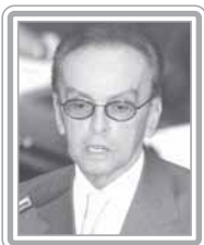
JEFFERSON PERES – PDT/AM

Deputada, 4º mandato, médica. Parlamentar atuante, é a principal líder da bancada feminina na Câmara. Historicamente vinculada aos movimentos sociais, é especialista em Seguridade Social. Boa articuladora, teve papel destacado no combate às reformas Administrativa e Previdenciária do Governo FHC. Diretora da Frente Parlamentar da Saúde, atua prioritariamente na área de saúde, no setor naval e junto aos trabalhadores das empresas de energia. Coerente com sua história de defesa do Estado Nacional, da Previdência Pública e dos direitos dos trabalhadores, votou contra a reforma da Previdência do Governo Lula. Destaca-se como debatedora.