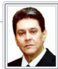
ROBERTO JEFFERSON - PTB/RJ

Deputado, 6º mandato, advogado. Neto e filho de petebistas, é hoje o parlamentar mais antigo na bancada do partido. Parlamentar atuante, bem articulado, de posições firmes, presidiu a Comissão de Seguridade Social da Câmara. Relatou projetos de grande destaque nacional, como o que deu origem ao Sistema Nacional de Sangue, Componentes e Derivados (SINASAN); à Lei sobre Crimes Hediondos e ao Sistema Nacional de Armas (SINARM). Foi, também, relator do projeto que permite a união civil entre pessoas do mesmo sexo, ainda não aprovado pela Câmara. Já foi líder e atualmente é presidente nacional do PTB. Compôs a base dos Governos Collor, FHC e hoje apóia o presidente Lula. Sob o seu comando, o partido dobrou a bancada de parlamentares no Congresso e vem se modernizando. Grande orador, destaca-se como debatedor.