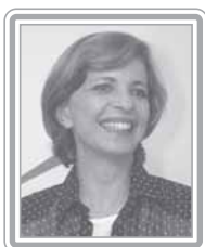
YEDA CRUSIUS - PSDB/RS

Deputado, 3º mandato, técnico em telecomunicações. Conhecedor profundo de assuntos de infra-estrutura, inclusão digital, telecomunicações, ciência e tecnologia, é muito respeitado pela qualidade de seus pronunciamentos. É autor do projeto de lei que obriga o governo a utilizar o software livre em seus computadores. Oriundo do movimento sindical, tem sido um defensor incansável dos assalariados, incluindo trabalhadores do setor privado, servidores públicos e aposentados e pensionistas. Acompanha e defende, com o mesmo empenho que nutre pelo patrimônio público e os interesses nacionais, as demandas do Nordeste em geral e da Bahia em particular. Ex-líder do PT na Câmara, com excelente trânsito no Congresso, é um dos mais competentes e eficazes vice-líderes do partido. Destaca-se como debatedor.