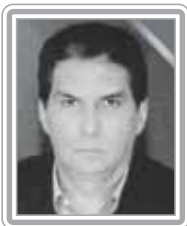
JADER BARBALHO – PMDB/PA

Deputado, 3º mandato, advogado, industrial e empresário rural e do setor de comunicação. Experiente e hábil na articulação política, foi líder do PMDB no Senado, presidente nacional do partido e presidente do Senado, além de governador do Pará, por duas vezes, e ministro da Reforma Agrária e da Previdência Social no Governo Sarney e presidente do Senado Federal. Na presidência do Senado, período que coincidiu com a renúncia dos senadores ACM e Arruda por fraude no painel eletrônico, teve que renunciar ao mandato para evitar um processo por quebra de decoro parlamentar, forçado por denúncias relativas ao período em que foi governador e ministro da Reforma Agrária. Eleito deputado em 2002, recuperou seu prestígio e poder no partido, onde exerce forte influência. Destaca-se como articulador.