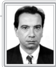
ALOYSIO NUNES FERREIRA - PSDB/SP

Deputado, 3º mandato, advogado. Parlamentar experiente, iniciou sua vida pública como deputado estadual (1983-87 e 1987-91), tendo sido vice-governador na Gestão Fleury, secretário de Justiça (1981) e secretário de Transportes Metropolitanos no Estado de São Paulo (1991-94), além de ministro da Justiça e chefe da Secretaria-Geral da Presidência da República no Governo FHC. Ex-presidente da Comissão de Constituição e Justiça da Câmara, é respeitado por seu saber jurídico e capacidade de articulação. Vice-presidente do PSDB, faz oposição propositiva ao Governo Lula. Destaca-se como debatedor.