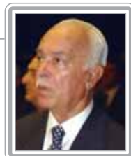
ANTONIO CARLOS MAGALHÃES - PFL/BA

Senador, 2º mandato, empresário, médico e jornalista. Político profissional, está entre as principais lideranças do Partido da Frente Liberal. Polêmico e ousado, evoluiu da condição de líder regional para uma posição de projeção nacional, tendo sido um dos homens mais poderosos da República durante o Governo FHC, especialmente nos dois períodos em que presidiu o Senado Federal. Foi três vezes governador da Bahia, além de ministro das Comunicações no Governo Sarney. Extremamente bem articulado, embora na oposição, tem fácil acesso ao Governo Lula, especialmente por intermédio do ministro-chefe da Casa Civil, José Dirceu. Inclui-se entre os formadores de opinião.