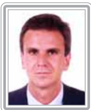
EDUARDO PAES - PSDB/RJ

Senador, 1º mandato, engenheiro. Com a experiência de quem foi prefeito de Belo Horizonte e governador de Minas Gerais, estreou no Senado com desenvoltura de veterano. É especialista em tecnologia da informação, tendo sido presidente da Empresa de Processamento de Dados do Estado de Minas Gerais, superintendente da DATAMEC, da Empresa de Processamento de Dados de Belo Horizonte, além de presidente do Serviço Federal de Processamento de Dados – SERPRO. Politicamente articulado e tecnicamente preparado, faz uma oposição responsável ao Governo Lula. Membro efetivo das Comissões de Assuntos Econômicos, Assuntos Sociais e de Relações Exteriores, tem surpreendido pela assiduidade e qualidade de suas intervenções. Parlamentar discreto, de forte rigor ético, destaca-se como articulador.