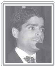
ANTONIO CARLOS MAGALHÃES NETO - ACM NETO - PFL/BA

Senador, 2º mandato, empresário, médico e jornalista. Político profissional, está entre as principais lideranças do Partido da Frente Liberal. Polêmico e ousado, evoluiu da condição de líder regional para uma posição de projeção nacional, tendo sido um dos homens mais poderosos da República durante o Governo FHC, especialmente nos dois períodos em que presidiu o Senado Federal. Foi três vezes governador da Bahia, além de ministro das Comunicações no Governo Sarney. Extremamente bem articulado, embora na oposição, tem fácil acesso ao Governo Lula, especialmente por intermédio do ministro-chefe da Casa Civil, José Dirceu. Inclui-se entre os formadores de opinião.