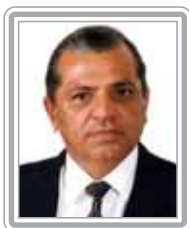
INOCÊNCIO OLIVEIRA - PFL/PE

Deputado, 3º mandato, servidor público. Identificado com as lutas populares, sempre atuou como coordenador no Estado de movimentos cívicos como nas Diretas-Já, no impeachment de Collor, além de liderar o movimento de moradores de bairros e favelas de Fortaleza. Antes de chegar à Câmara Federal, foi vereador em Fortaleza e deputado estadual no Ceará. Ex-líder do PCdoB na Câmara, foi também presidente da Comissão de Desenvolvimento Urbano. Autor da Proposta de Emenda Constitucional que fixa a jornada em 40 horas semanais, é um parlamentar muito atuante no Congresso. Defensor dos assalariados sofreu por ocasião da votação da reforma da Previdência, que suprimia direitos dos servidores. Além dos direitos sociais dos trabalhadores, prioriza as questões urbanas, como habitação popular e saneamento. Destaca-se como debatedor.