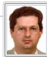
JUTAHY JÚNIOR – PSDB/BA

Deputado, 5º mandato, advogado. Político experiente, de família tradicional no Estado, foi secretário da Justiça e Direitos Humanos no Governo Waldir Pires (1988-89) e ministro do Bem-Estar Social no Governo Itamar Franco (1992). Parlamentar atuante, teve presença marcante como principal negociador do PSDB e do Governo FHC durante as votações da reforma do Judiciário, tanto nas comissões quanto no plenário. Ex-líder e atual vice-líder do PSDB na Câmara, com bom trânsito no Congresso, tem feito forte oposição ao Governo Lula. Destaca-se como articulador.