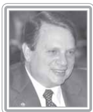
TASSO JEREISSATI - PSDB/CE

Deputado, 3º mandato, advogado. Parlamentar discreto, de postura ética irretocável, integra o núcleo de articuladores do Congresso Nacional. Político de grande credibilidade, foi relator da Subcomissão da União, Distrito Federal e Territórios na Constituinte e um dos mais destacados integrantes da CPI do Orçamento e da CPI que culminou no impeachment do ex-presidente Fernando Collor. Atual vice-líder e interlocutor do Governo em assuntos políticos e jurídicos, conhece o presidente Lula há mais de 20 anos. Historicamente vinculado à defesa dos direitos humanos, destaca-se como articulador.