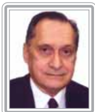
ROBERTO MAGALHÃES – PTB/PE

Deputado, 6º mandato, advogado. Neto e filho de petebistas, é hoje o parlamentar mais antigo na bancada do partido. Parlamentar atuante, bem articulado, de posições firmes, presidiu a Comissão de Seguridade Social da Câmara. Relatou projetos de grande destaque nacional, como o que deu origem ao Sistema Nacional de Sangue, Componentes e Derivados (SINASAN); à Lei sobre Crimes Hediondos e ao Sistema Nacional de Armas (SINARM). Foi, também, relator do projeto que permite a união civil entre pessoas do mesmo sexo, ainda não aprovado pela Câmara. Já foi líder e atualmente é presidente nacional do PTB. Compôs a base dos Governos Collor, FHC e hoje apóia o presidente Lula. Sob o seu comando, o partido dobrou a bancada de parlamentares no Congresso e vem se modernizando. Grande orador, destaca-se como debatedor.