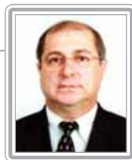
PAULO BERNARDO - PT/PR

Deputado, 3º mandato, bancário. Parlamentar atuante, iniciou sua trajetória política no movimento estudantil e, posteriormente, passou a militar no movimento sindical, tendo sido diretor da Federação dos Bancários do Estado do Paraná. No Congresso, especializou-se em orçamento e fiscalização das finanças públicas, constituindo-se numa das principais referências sobre estes temas. Após presidir a Comissão de Fiscalização e Controle da Câmara, afastou-se do Congresso para assumir a Secretaria de Fazenda de Mato Grosso do Sul. Presidente da poderosa Comissão Mista de Orçamento, foi relator da primeira LDO do Governo Lula e tem sido um dos principais operadores do partido na defesa das matérias de iniciativa do Poder Executivo. Destaca-se como articulador.