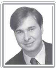
RODRIGO MAIA - PFL/RJ

Deputado, 2º mandato, analista financeiro. Filho do prefeito do Rio de Janeiro, César Maia, já ocupou o cargo de secretário municipal de Governo na Prefeitura da cidade. Com experiência no mercado financeiro, com passagem pelo Banco BMG e Icatu, prioriza em sua atuação o mercado de capitais, matérias financeiras e tributárias, trabalhistas e relativas à geração de emprego e renda. Parlamentar bem articulado, ex-presidente da Comissão de Trabalho, Administração e Serviço Público, conquistou seu espaço na elite parlamentar por mérito próprio. Primeiro vice-líder do PFL, é um opositor qualificado do Governo Lula no Congresso. Destaca-se como debatedor.