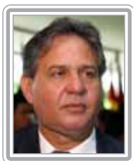
ANTERO DE BARROS - PSDB/MT

Deputado, 3º mandato, advogado. Parlamentar experiente, iniciou sua vida pública como deputado estadual (1983-87 e 1987-91), tendo sido vice-governador na Gestão Fleury, secretário de Justiça (1981) e secretário de Transportes Metropolitanos no Estado de São Paulo (1991-94), além de ministro da Justiça e chefe da Secretaria-Geral da Presidência da República no Governo FHC. Ex-presidente da Comissão de Constituição e Justiça da Câmara, é respeitado por seu saber jurídico e capacidade de articulação. Vice-presidente do PSDB, faz oposição propositiva ao Governo Lula. Destaca-se como debatedor.