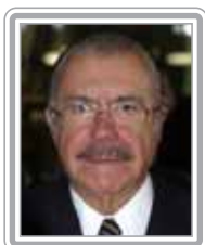
JOSÉ SARNEY - PMDB/AP

Deputado, 3º mandato, advogado e bancário. Parlamentar disciplinado e estudioso, é um defensor incansável de políticas de desenvolvimento regional para o Nordeste. Fundador do PT no Estado do Ceará e diretor do Sindicato dos Bancários do Estado, foi também secretário-geral da CUT regional. É referência na bancada em matérias previdenciária, financeira e tributária. Foi autor da Lei que criou o Fundo de Universalização dos Serviços de Telecomunicações (FUST) e dos requerimentos das CPIs do Finor e do Proer. Com a experiência de relator-adjunto da lei complementar dos fundos de pensão das estatais, foi designado relator da Proposta de Emenda à Constituição da Reforma da Previdência do Governo Lula, tarefa que cumpriu com determinação, disciplina partidária, discrição e competência. Bem articulado e muito atuante no Congresso, além de bem avaliado pelos institutos que acompanham os trabalhos do Congresso, inclusive o jornal Folha de São Paulo, é um parlamentar com grande prestígio junto ao núcleo central do Governo Lula. Bom negociador, destaca-se como formulador.