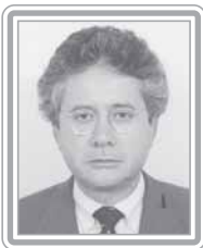
PAULO DELGADO - PT/MG

Deputado, 3º mandato, bancário. Parlamentar atuante, iniciou sua trajetória política no movimento estudantil e, posteriormente, passou a militar no movimento sindical, tendo sido diretor da Federação dos Bancários do Estado do Paraná. No Congresso, especializou-se em orçamento e fiscalização das finanças públicas, constituindo-se numa das principais referências sobre estes temas. Após presidir a Comissão de Fiscalização e Controle da Câmara, afastou-se do Congresso para assumir a Secretaria de Fazenda de Mato Grosso do Sul. Presidente da poderosa Comissão Mista de Orçamento, foi relator da primeira LDO do Governo Lula e tem sido um dos principais operadores do partido na defesa das matérias de iniciativa do Poder Executivo. Destaca-se como articulador.