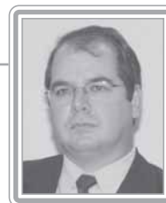
TIÃO VIANA - PT/AC

Senador, 1º mandato, médico. Irmão do governador do Acre, Jorge Viana, é um parlamentar em franca ascensão no Congresso. De atuação discreta, com o mandato inicialmente voltado para os interesses regionais e os temas ligados à saúde pública, ganhou projeção como líder do PT no Senado, quando revelou uma grande capacidade de articulação e negociação. Fiel e leal ao Governo Lula, de quem é um interlocutor privilegiado, recebeu a missão de relator da reforma da Previdência no Senado, um tema dos mais complexos. Destaca-se como negociador.