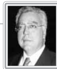
MIRO TEIXEIRA - PPS/RJ

Deputado, 8º mandato, jornalista e advogado. Político experiente, com excelente trânsito no Congresso, integra o núcleo dos formadores de opinião. Na Constituinte, pertenceu à Comissão da Organização dos Poderes e Sistema de Governo. Ex-líder do PDT, é uma das principais referências do Congresso no debate de questões políticas e institucionais. Negociador aplicado, é muito ativo nos trabalhos de plenário e nos bastidores.