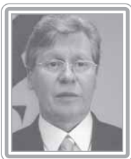
ARTHUR VIRGÍLIO - PSDB/AM

Senador, 1º mandato, diplomata e advogado. Com tradição nas lutas democráticas, é um parlamentar com visão nacional. Foi prefeito de Manaus (89/92), ministro-chefe da Secretaria-Geral da Presidência da República e conselheiro de Governo na Presidência da República no segundo Governo FHC. Na oportunidade de seu terceiro mandato de deputado federal, ganhou enorme projeção como líder do Governo Fernando Henrique no Congresso, função que exerceu com dedicação exemplar. Excelente orador, é homem de diálogo e sempre priorizou o debate dos grandes problemas nacionais da tribuna do Congresso, tanto como líder do Governo FHC na Câmara, quanto como líder da oposição, no Senado. Um dos principais expoentes do PSDB, é incansável na oposição ao Governo Lula. Destaca-se como debatedor.