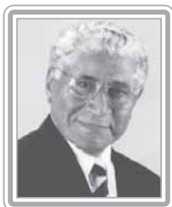
ALCEU COLLARES - PDT/RS

Deputado, 6º mandato, engenheiro civil. Parlamentar experiente e articulado, foi secretário de Estado em São Paulo, no Governo Quéricia, e ministro dos Transportes no Governo do presidente Itamar Franco. Primeiro vice-líder do PSDB na Câmara, é um debatedor qualificado. Autor da fórmula de flexibilização dos monopólios do petróleo e telecomunicações, foi pioneiro na privatização das rodovias e portos. Presidiu duas importantes Comissões Especiais na quebra do monopólio e regulamentação da PEC do Petróleo, além de ter sido relator da Lei Geral de Telecomunicações. Conhecedor dos temas de infra-estrutura, destaca-se como formulador.