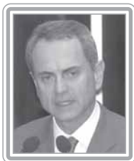
PAULO OCTÁVIO - PFL/DF

Senador, 1º mandato, advogado e empresário. Dirigente empresarial e grande incorporador do Distrito Federal, foi presidente da Câmara de Valores Imobiliários do Distrito Federal e da Associação dos Dirigentes de empresa do Mercado Imobiliário do Distrito Federal. Casado com uma neta de Juscelino Kubitschek, é um defensor entusiasta de Brasília. Além da luta para manter a sede dos órgãos federais no DF, para a inclusão de Brasília nos roteiros turísticos, foi membro da Comissão Pró-Olimpíadas Brasília 2000 e presidente da Associação Brasília Olímpica 2000 e 2004. Deputado federal por dois mandatos, estreou no Senado com desenvoltura de veterano. Com bom trânsito no Congresso, é vice-presidente da Comissão de Assuntos Econômicos e presidente da Subcomissão de Turismo no Senado. Um dos vice-líderes mais ativos do PFL no Senado, destaca-se como articulador.