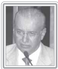
ANTÔNIO CARLOS VALADARES – PSB/SE

Senador, 2º mandato, advogado e químico. Político experiente, foi prefeito de Simão Dias/SE (1967-70), deputado estadual por duas legislaturas (1971-74 e 75-78), deputado federal (1979-82), secretário estadual de Educação e Cultura, além de vice-governador (1983-86) e governador de Sergipe (1987-90). Parlamentar atuante e de perfil progressista, no exercício de seus mandatos tem combinado o interesse regional com os temas de amplitude nacional. Líder do PSB, no Senado vem se revelando um grande articulador. Defensor da revitalização, antes de qualquer transposição, das águas do Rio São Francisco, destaca-se como debatedor. Apóia criticamente o Governo Lula.