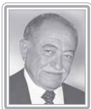
MIGUEL ARRAES - PSB/PE

Deputado, 5º mandato, advogado e professor. Parlamentar de boa formação intelectual, com doutorado em Direito, é um dos poucos juristas do Congresso. Preparado, didático na forma de expor, foi eleito e reeleito presidente da Câmara dos Deputados nos períodos 1997-1998 e 1999-2000. Com passagem pelo Poder Executivo estadual, foi secretário de Segurança Pública no Governo Franco Montoro e de Governo na gestão do governador Antônio Fleury. Presidente nacional do PMDB, já foi líder do partido na Câmara. Foi relator da Emenda Constitucional nº 20/98, da reforma da Previdência. Um dos principais operadores da reforma constitucional no Governo FHC, é um dos mais influentes integrantes da elite parlamentar. Destaca-se como formador de opinião.