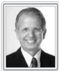
JOSÉ MÚCIO MONTEIRO - PTB/PE

Deputado, 3º mandato, pernambucano, engenheiro e usineiro. Atual líder do PTB na Câmara, já pertenceu aos grupos políticos de Marco Maciel e Roberto Magalhães. Experiente, foi prefeito de Rio Formoso (1992-93) e secretário de Transportes, Comunicação e Energia no Governo Roberto Magalhães (1983-86), além de presidente da Companhia de Eletricidade de Pernambuco (1983). Defensor da economia de mercado, relator do projeto de flexibilização da CLT, foi também presidente da Comissão de Trabalho, Administração e Serviço Público da Câmara. Parlamentar atuante, com boa capacidade de articulação e negociação, é um político com excelente trânsito no Congresso. Ex-presidente nacional do PFL, destaca-se como articulador.