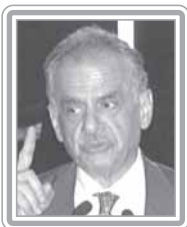
PEDRO SIMON - PMDB/RS

Senador, 3º mandato, advogado e professor universitário. Excelente orador, é uma das reservas morais do Parlamento. Ético, trabalhador e responsável, é um político com passado limpo. Membro do grupo autêntico do PMDB, foi um dos principais articuladores da candidatura de Tancredo Neves à Presidência da República. Ministro da Agricultura no Governo Sarney, eleito governador do Rio Grande do Sul, foi líder e coordenador político do Governo Itamar Franco no Senado. Bom articulador político, foi uma das estrelas da CPI dos Bancos no Senado. Crítico da política de juros elevados do Governo FHC, tem tido uma postura de independência em relação ao Governo Lula. Destaca-se como debatedor.