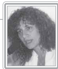
JANDIRA FEGHALLI – PCdoB/RJ

Deputada, 4º mandato, médica. Parlamentar atuante, é a principal líder da bancada feminina na Câmara. Historicamente vinculada aos movimentos sociais, é especialista em Seguridade Social. Boa articuladora, teve papel destacado no combate às reformas Administrativa e Previdenciária do Governo FHC. Diretora da Frente Parlamentar da Saúde, atua prioritariamente na área de saúde, no setor naval e junto aos trabalhadores das empresas de energia. Coerente com sua história de defesa do Estado Nacional, da Previdência Pública e dos direitos dos trabalhadores, votou contra a reforma da Previdência do Governo Lula. Destaca-se como debatedora.