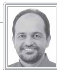
WALTER PINHEIRO - PT/BA

Deputado, 3º mandato, técnico em telecomunicações. Conhecedor profundo de assuntos de infra-estrutura, inclusão digital, telecomunicações, ciência e tecnologia, é muito respeitado pela qualidade de seus pronunciamentos. É autor do projeto de lei que obriga o governo a utilizar o software livre em seus computadores. Oriundo do movimento sindical, tem sido um defensor incansável dos assalariados, incluindo trabalhadores do setor privado, servidores públicos e aposentados e pensionistas. Acompanha e defende, com o mesmo empenho que nutre pelo patrimônio público e os interesses nacionais, as demandas do Nordeste em geral e da Bahia em particular. Ex-líder do PT na Câmara, com excelente trânsito no Congresso, é um dos mais competentes e eficazes vice-líderes do partido. Destaca-se como debatedor.