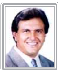
RONALDO CAIADO - PFL/GO

Senador, 2º mandato, economista. Político experiente, foi chefe de gabinete da Secretaria de Estado da Habitação (1979), governador de Roraima nomeado pelo presidente da República (1989-90) e secretário nacional de Habitação (1992), além de presidente da FUNAI. Iniciou sua vida pública pelas mãos de Marco Maciel. Parlamentar atuante, já pertenceu ao PFL, quando foi vice-líder do partido, e ao PSDB, quando foi vice-líder e líder do Governo FHC no Senado. Recentemente migrou para o PMDB, aonde vem tendo uma desenvoltura de veterano. Nas legislaturas anteriores, foi relator da reforma administrativa e do projeto de carreiras exclusivas no Senado. Atual vice-líder do Governo no Senado, destaca-se como debatedor.