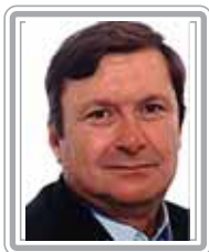
SÉRGIO MIRANDA - PCdoB/MG

Deputado, 4º mandato, professor. Fiscalizador da boa aplicação dos recursos públicos, é um dos parlamentares que mais entende de finanças públicas e matéria orçamentária no Congresso. Estudioso e dedicado ao debate dos grandes temas nacionais, com enfoque na defesa do patrimônio público, nos interesses do país e dos assalariados, é autor de várias proposições de políticas públicas nas áreas regulatória e redistributiva. Membro ativo das Comissões de Constituição e Justiça e da Comissão Mista de Orçamento, combateu com argumentos consistentes as tentativas do desmonte do Aparelho de Estado durante os Governos de FHC. Crítico da política econômica do Governo Lula, disse não à reforma da Previdência do Poder Executivo. Conhecido pela seriedade e lealdade com que exerce seus mandatos, é um parlamentar de grande credibilidade no Congresso. Bom debatedor, destaca-se como formulador.