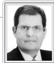
ROBERTO BRANT – PFL/MG

Deputado, 5º mandato, advogado e professor. Parlamentar experiente, foi presidente da Caixa e do Banco de Desenvolvimento Mineiro, além de subsecretário de Planejamento e Coordenação-Geral do Estado (1972-73), secretário da Fazenda do Estado, no Governo Tancredo Neves (1991-94) e, mais recentemente, ministro da Previdência do Governo Fernando Henrique Cardoso. Especialista nas áreas financeira e tributária, é defensor da economia de mercado. Relator da Proposta de Emenda Constitucional que regulamenta o uso de medidas provisórias, presidiu a Comissão Especial que tratou da reforma da Previdência no Governo Lula. Destaca-se como formulador.