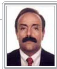
LUIZ EDUARDO GREENHALGH - PT/SP

Deputado, 4º mandato, advogado. De sólida formação jurídica, foi presidente da Comissão de Constituição e Justiça da Câmara, quando prestou relevantes serviços ao Governo Lula. Político atuante e bem articulado, foi vice-prefeito de São Paulo, na gestão de Luiza Erundina, além de secretário de Defesa Social e secretário dos Negócios Extraordinários. Com predileção pelas áreas de direitos humanos, meio ambiente e relações internacionais, é referência nessas matérias no Congresso. Com excelente trânsito na Câmara, é um parlamentar em franca ascensão no Legislativo. Destaca-se como negociador.