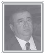
HERÁCLITO FORTES - PFL/PI

Senador, 1º mandato, servidor público. Político experiente, foi deputado federal por quatro mandatos e prefeito de Teresina no Piauí (1989-92). Atual terceiro secretário do Senado, foi vice-líder do PFL na Câmara e 1º vice-presidente da Câmara nas gestões de Michel Temer e Aécio Neves na legislatura passada. Ex-presidente do Fundo de Pensão dos Correios e do Instituto de Previdência do Congresso (IPC), é um parlamentar de atuação discreta. Foi um aliado fiel ao Governo FHC, de quem foi líder no Congresso por curto período. Homem de bastidor, destaca-se como articulador.