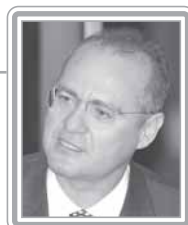
RENAN CALHEIROS - PMDB/AL

Senador, 2º mandato, advogado. Parlamentar dinâmico e de boa formação, lidera o PMDB no Senado. Ministro da Justiça de Fernando Henrique, um dos mais populares, saiu por não concordar com a nomeação de um delegado acusado de torturar para a chefia da Polícia Federal. Articulador habilidoso, foi o 2º secretário da Mesa do Senado, quando coordenou uma comissão de reforma daquele órgão do Poder Legislativo. Principal interlocutor de PMDB com o Governo Lula, é hoje a maior liderança nacional do partido. Político de futuro promissor, aspira a concorrer à presidência do Senado em 2004 e ao Governo de Alagoas em 2006. Destaca-se como articulador.