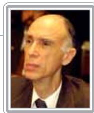
MARCO MACIEL - PFL/PE

Senador, 3º mandato, advogado e professor. Iniciou sua carreira política como líder estudantil, presidindo a União dos Estudantes de Pernambuco. Elegeu-se deputado estadual em 1967 e foi reeleito em 1971. Político experiente, de grande capacidade de aglutinação, foi um dos coordenadores da aliança que levou a chapa Tancredo/Sarney à vitória no Colégio Eleitoral. Governador, presidente da Câmara e ministro da Educação e da Casa Civil no Governo Sarney, sempre integrou o núcleo de parlamentares influentes do Congresso. Vice-presidente nos dois mandatos de FHC, é um conhecedor em profundidade dos sistemas eleitoral e partidário. Destaca-se como articulador.