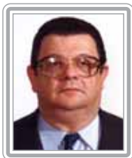
DELFIN NETTO - PP/SP

Deputado, 5º mandato, economista e professor. Parlamentar experiente, foi secretário de Fazenda do Estado de São Paulo e ministro de três pastas durante os governos militares: Fazenda, Agricultura e Planejamento. Reconhecido por seu saber e preparo, goza de grande prestígio no Congresso. Representa os interesses do empresariado no Poder Legislativo, onde exerce forte influência sobre os temas econômicos. É um dos parlamentares mais influentes do Congresso, mesmo não exercendo nenhum posto formal na estrutura da Câmara. Foi presidente das Comissões de Fiscalização Financeira e Controle e de Finanças e Tributação. Destaca-se como formador de opinião.