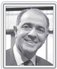
JOSÉ CARLOS ALELUIA – PFL/BA

Deputado, 3º mandato, comerciante e pecuarista. Parlamentar de atuação discreta, especializou-se em matéria orçamentária, tendo sido durante anos um dos caciques da Comissão Mista de Orçamento do Congresso. Municipalista, já foi-vereador (1977-92) e prefeito de Jandaia do Sul (1989-93). Oriundo da Arena, com passagem pelo PTB, quando foi homem de confiança do ex-senador Andrade Vieira, chegou ao PMDB durante o 2º mandato de FHC. Vice-líder do PMDB na Câmara, foi escolhido líder por indicação do atual ministro das Comunicações, Eunício Oliveira. Apoiou o governo FHC com o mesmo entusiasmo com que apóia o Governo Lula. Pertence à bancada ruralista. Destaca-se como articulador.