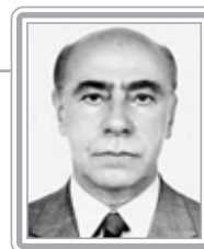
IBRAHIM ABI-ACKEL - PP/MG

Deputado, 7º mandato, advogado e professor universitário. Ministro da Justiça no Governo Figueiredo, é um dos juristas mais requisitados no Congresso. Foi relator-adjunto do então deputado e atual ministro do STF, Nelson Jobim, na revisão constitucional. Respeitado por seu saber e capacidade de argumentação, é consultado com frequência pelos colegas da Comissão de Constituição e Justiça, notadamente em assuntos eleitorais, regimentais e questões políticas e institucionais. Apesar de discreto, é um excelente orador. Destaca-se como formulador.