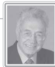
ELISEU RESENDE - PFL/MG

Deputado, 3º mandato, engenheiro civil e administrador. Político experiente, já exerceu os cargos de ministro dos Transportes, no Governo Figueiredo, e da Fazenda, no Governo Itamar Franco, além de ter sido presidente da Eletrobrás. Ex-presidente da Comissão de Finanças e Tributação, também já presidiu a Comissão de Minas e Energia da Câmara. Especialista em infra-estrutura, é consultado com frequência sobre transporte, mineração, petróleo, energia elétrica, telecomunicações e finanças públicas. Foi relator de vários projetos relevantes, entre os quais o que regulamentou a quebra do monopólio estatal do petróleo. Discreto em sua atuação, hábil e articulado, destaca-se como formulador.