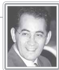
JOÃO PAULO CUNHA – PT/SP

Deputado, 3º mandato, metalúrgico-programador de produção. Uma das revelações do Congresso, o atual presidente da Câmara é um exemplo de disciplina e persistência. Recebeu importantes missões do partido, desde a fiscalização dos gastos públicos do Governo FHC, passando pela responsabilidade de acompanhar e apresentar alternativas às reformas da legislação eleitoral e partidária, até a participação no programa de governo da candidatura presidencial de Lula em 2002. Designado vice-líder, esperou pacientemente a sua vez de liderar o partido, tarefa que exerceu com competência e dignidade. Como presidente da Câmara, foi o principal operador político do governo no Congresso, abrindo os canais de entendimento para aprovação das matérias, contribuindo para a pacificação dos poderes e facilitando a governabilidade na gestão do presidente Lula. A aprovação das reformas previdenciária e tributária, por exemplo, foi possível graças à prudência, seriedade e espírito de pacificação do presidente da Câmara. Destaca-se como articulador.