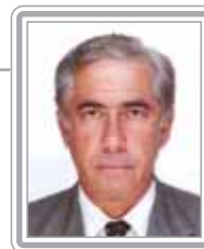
SIGMARINGA SEIXAS - PT/DF

Deputado, 3º mandato, advogado. Parlamentar discreto, de postura ética irretocável, integra o núcleo de articuladores do Congresso Nacional. Político de grande credibilidade, foi relator da Subcomissão da União, Distrito Federal e Territórios na Constituinte e um dos mais destacados integrantes da CPI do Orçamento e da CPI que culminou no impeachment do ex-presidente Fernando Collor. Atual vice-líder e interlocutor do Governo em assuntos políticos e jurídicos, conhece o presidente Lula há mais de 20 anos. Historicamente vinculado à defesa dos direitos humanos, destaca-se como articulador.